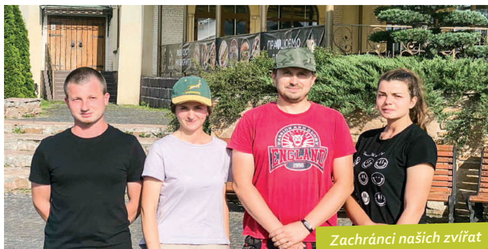
Zachránci našich zvířat

Budoucnost nevypadá růžově. Zoo není nákupní centrum ani restaurace, kterou lze odpojit od sítě, zavítat a počkat na lepší časy. Nelze jej ani „optimalizovat“, protože všechny jeho složky, jako je krmivo, vytápění od podzimu do léta, úklid a údržba se prostě nedají zredukovat – proto si musíme utáhnout opasky. Procházíme opravdu vážnou zkouškou a nebudete nám asi nic jiného (dokud nejsou návštěvníci), než požádat o pomoc, protože sami bohužel udržet zoo nedokážeme.