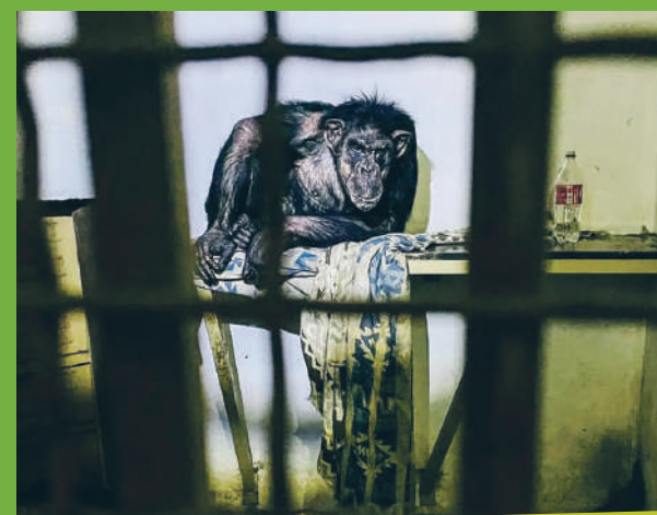
Fotografie z okupace, John, březen 2022

Záchrana zvířat ve válečných podmínkách není snadná. Malá a klidná zvířata se ještě dají nějak zahřát, přemístit a nakrmit, ale u těch větších je to nepřekonatelný úkol. Třeba na nosorožce nelze dát deku a jakmile teplota klesne pod 18 stupňů,