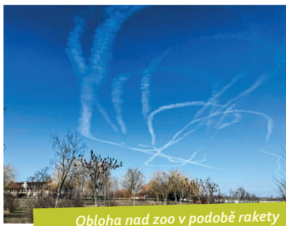
Obloha nad zoo v podobě rakety

Nejhůř byli postiženi predátoři. Vždycky jsme si brali zásoby masa na dva týdny. Potřebujeme ho hodně a ve válečných podmínkách bylo téměř nemožné ho sehnat. Jediným důvodem, proč zvířata přežila toto období, byla relativně krátká doba okupace – něco málo přes měsíc. Když bylo všechno maso v okolí (včetně zbytků, kůží a podobně) spotřebováno, zbývalo udělat jediné – nemyslet ze středně a dlouhodobé perspektivy, ale hledat krmivo denní potřeby na jeden den dopředu. Když se něco našlo, tak jsem děkoval Bohu. Zní to brutálně, ale v jednom případě nám zármutek souseda umožnil přežití našich zvířat – poblíž zoo se nachází koňský ranč, kde se soused musel rozloučit s jedním koněm, který si zlomil nohu, a pak s dalším. A toto