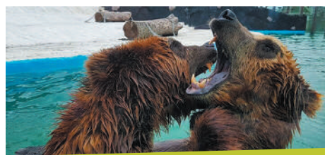
Kamčaťští medvědi Toby a Kuba, kteří přijeli z brněnské zoo (Česká republika)

Nepřátelská vojska částečně poškodila také naše kanceláře – celkově to však byly malé ztráty. Je nepatřičné takové škody vůbec zmiňovat, protože se v tomto ohledu ve srovnání s jinými městy považujeme za šťastlivce (do Buče je to dvacet kilometrů). Nevzdal jsem se sice naděje, že vypátrám, kam se poděly mé nové boty ze skříňe, a stále uchovávám jako důkaz ošuntělé ruské armádní boty, které zaujaly jejich místo – takto žertujeme, když se nás ptají na naše ztráty.