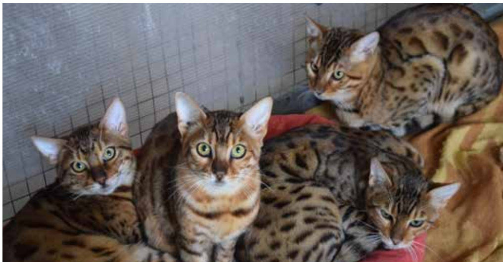
koťata kočky bengálské

Jako každý rok, i letos, se nám na začátku roku narodila kopa mláďat. Rozhodně si nezapomeňte prohlédnout tři krásná koťata kočky bengálské, dvě telata skotu watusi nebo náš první odchov kůzlat kozy burské. Na Babiččině dvorečku můžete spatřit selátka přeštického prasete i selátka mangalice. Pohládit se zde jistě nechají pobíhající jehňátka, kůzlátka a další mláďata.