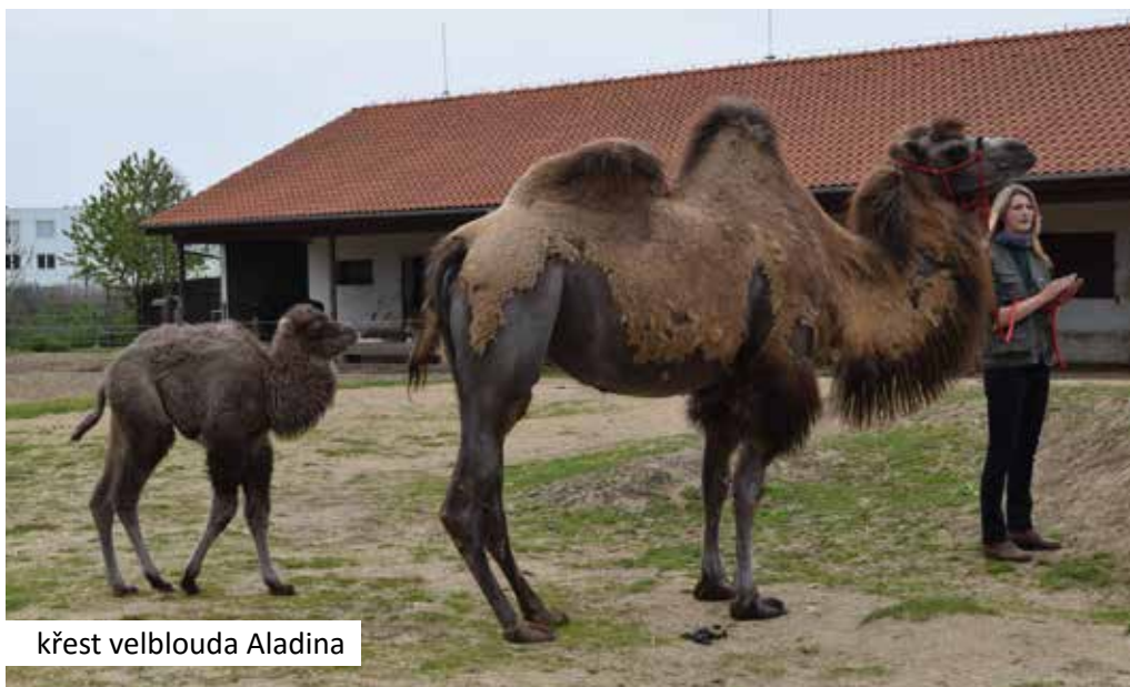
křest velblouda Aladina