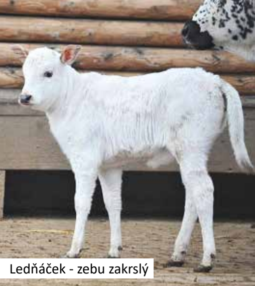
Ledňáček - zebu zakrslý